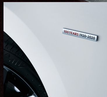
Emblém 100th Anniversary