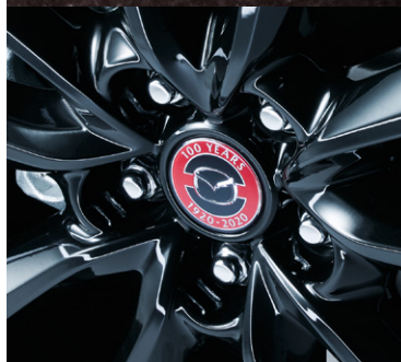
Středové krytky kol