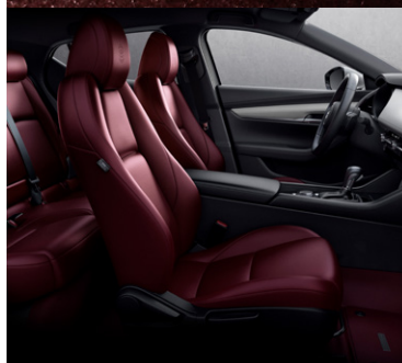
Vínové červené čalounění sedadel